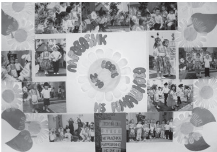
Фотогазета. Паровозик из Ромашково

тии, ведь с той поры в ДОУ прошла целая череда не менее интересных праздников. В следующий раз перед началом очередного мероприятия решено было обратиться к одной из мам – профессиональному фотографу с просьбой сбросить на диск все удачные фотографии, которые та сделает во время досуга. Очень скоро музыкальному руководителю вернули диск, на который была записана серия фотографий, на них был один и тот же ребенок – дочь мамы-фотографа. Газета все же вышла, она получилась яркой, радостной, с большим количеством удачных снимков. Родители других детей с оживлением и интересом толпились возле нее, желая увидеть каждый своего ребенка, но, увы! Со всех снимков на них смотрела одна и та же девочка! Где же их дети? А их сыновья и дочери в свою очередь задавали тот же самый вопрос: «А где тут я?». И что могли им ответить мамы, которые почти все были на празднике с фотоаппаратами, но так и не передали воспитателю ни одну из их фотографий. Если бы они своевременно принесли снимки, тогда на лицах стоящих