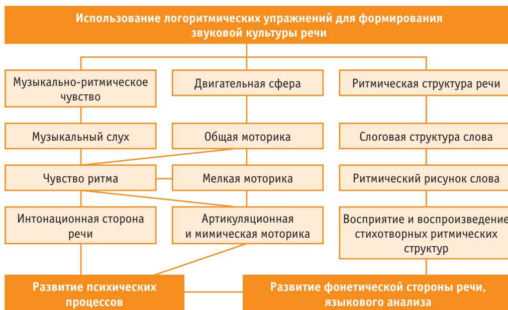
Схема. Развивающее значение логоритмических упражнений в формировании звуковой культуры речи