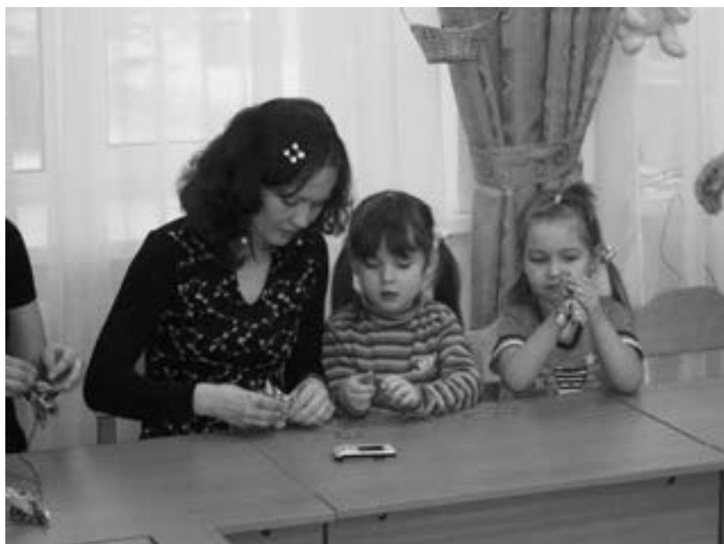
Рис. 3. Воспитанники детского сада № 2527 вместе с родителями делают ангела