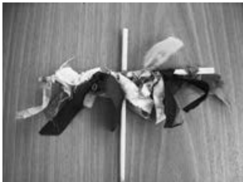
Рис. 1. Кукла «Крестец»

«самости»: самостоятельности, саморефлексии и саморегуляции.