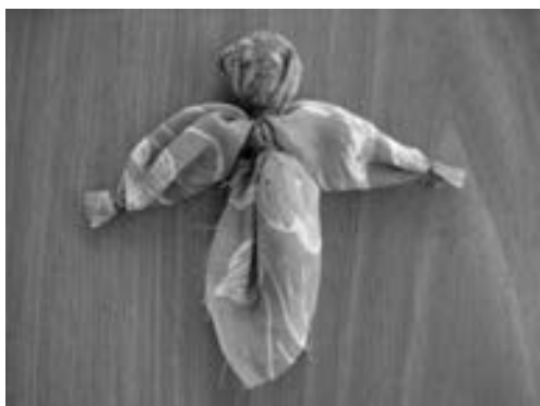
Рис. 2. Кукла «Рождественский ангел»

Технология изготовления народных кукол проста. Их можно смастерить из лоскутов тканей, ниток, соломы, лыка. Следуя традиции, кукол не нужно шить, достаточно связать, не используя при этом иглу. Под руководством взрослого приема изготовления кукол может освоить даже ребенок в возрасте 3–4-х лет. Для наглядности малышу необходимо показать образец поделки, рассказать об игрушке, как ее можно изготовить, используя цветные изображения. Также необходимо проинструктировать детей, что им потребуется для ее создания и в какой последовательности нужно выполнять работу. В зависимости от возраста и