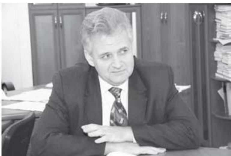
Первый заместитель министра образования и науки Республики Татарстан Д.М. Мустафин

Обсуждая проблему, каким должен быть современный детский сад в России, важно ознакомиться с тенденциями развития дошкольного образования в различных регионах страны, узнать о том, чем живут они, какие достижения имеют, каким передовым опытом и инновационными педагогическими технологиями могут поделиться. Редакция нашего журнала стремится представить читателям наиболее яркие и особенные материалы, характерные именно для конкретной области, города или республики. Наряду с общими для всех в масштабах страны проблемами дошкольного образования, являющимися следствием социально-экономической ситуации, единым содержательным компонентом воспитательно-образовательного процесса, обусловленным возрастными особенностями детей, следует отметить наличие региональной специфики в организации работы детских садов, вопросах руководства, управления и финансирования, а также региональных компонентов в методике воспитания и обучения дошкольников. Такой обмен опытом, безусловно, полезен для специалистов, работающих в сфере дошкольного образования. В этом номере журнала мы постараемся рассказать о современных детских садах Республики Татарстан. Открыть рубрику «Организация работы ДОУ» и представить основные направления развития дошкольного образования республики мы попросили Данила Махмутовича Мустафина.