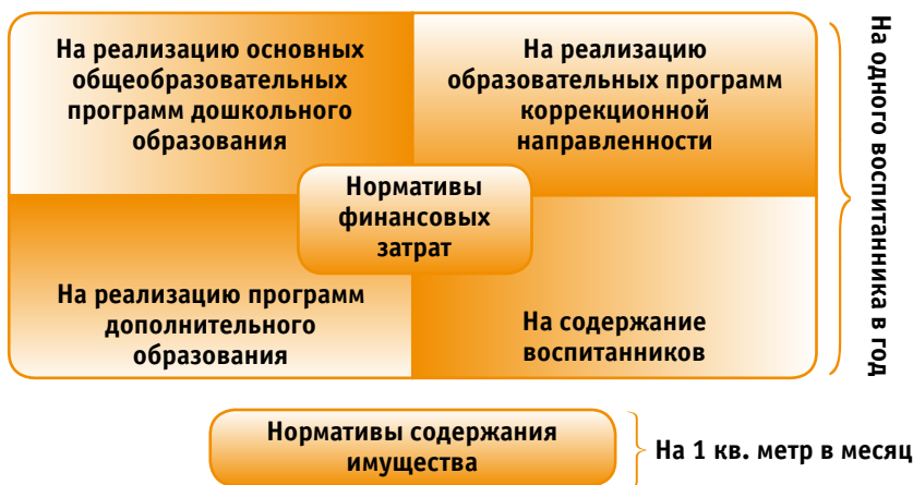
Рис. 1. Система нормативного финансирования дошкольных образовательных учреждений в Республике Татарстан

В свою очередь, каждый из указанных нормативов формируется отдельно в зависимости от территориальной дислокации, вида, режима работы образовательного учреждения и возраста детей. Согласно Закону Российской Федерации «Об образовании» от 10.07.1992 № 3266-1 нормативы финансовых затрат на реализацию основных общеобразовательных программ дошкольного образования, образовательных программ коррекционной направленности, программ дополнительного образования, содержания воспитанников в дошкольных образовательных учреждениях утверждаются ежегодно исполнительными комитетами муниципальных районов республики в расчете на одного воспитанника в год.