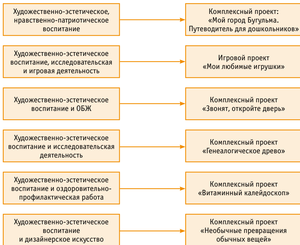
Рис. Интеграция различных видов детской деятельности и реализация творческих проектов

экспериментальной работы; проведение проблемно-ориентированного анализа для сопоставления достигнутых результатов с прогнозируемыми; изучение семей по типу, образовательному и социальному уровню, определение приоритетов родителей в области их педагогической грамотности; мониторинг потребностей в дополнительных образовательных услугах. Современная модель сотрудничества педагогов ДОО с семьями воспитанников строилась как процесс межличностного общения. В этом направлении коллектив нашего детского сада решал следующие задачи: объединение усилий педагогов и родителей для развития способностей детей; создание атмосферы общности интересов в процессе организации опытно-