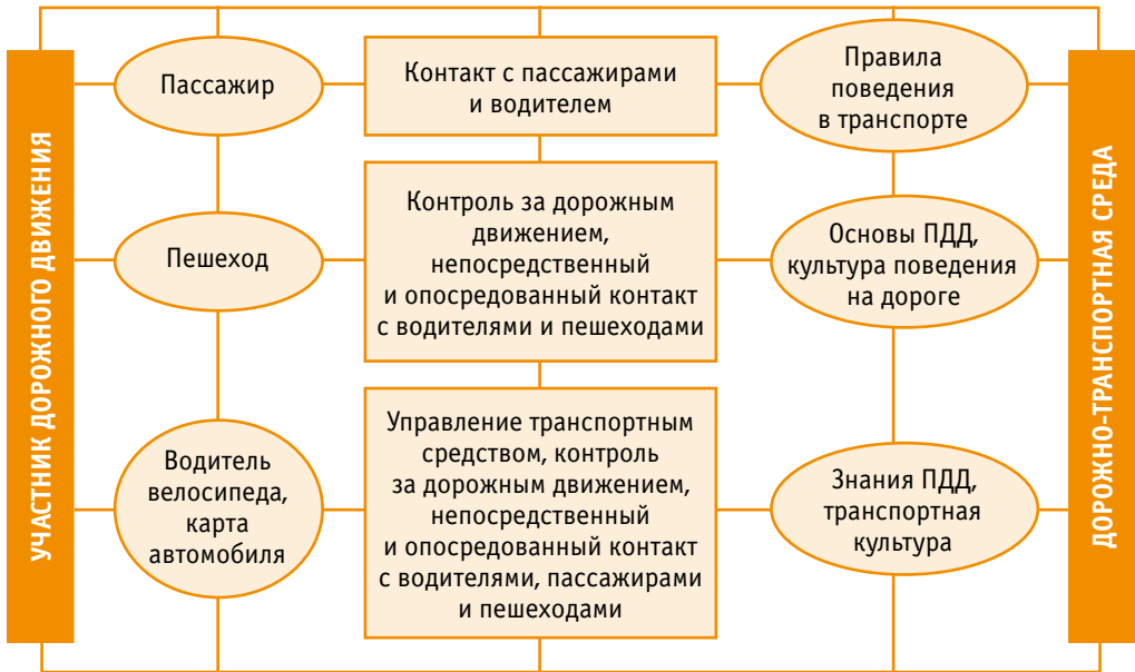
Рис. 2. Целевая модель участника дорожного движения

истории развития дорожного движения, они накапливались и приумножались. Каждое новое поколение наследовало все лучшее, что накопили их предшественники, внося в этот опыт новые нормы, выверенные и продиктованные жизнью и общественным развитием, способствующие повышению безопасности жизнедеятельности участников дорожного движения. Ретроспективный анализ показал, что воспитание транспортной культуры осуществляется путем регулирования освоения и выполнения развивающимся человеком системы социальных ролей в процессе поэтапной его социализации, таких, как «Я – пешеход», «Я – пассажир», «Я – водитель». Поэтапная социализация ребенка и освоение ролей «Я – пассажир», «Я – пешеход», «Я – водитель» базируется на эгоцентрической концепции овладения социо-ведческих и человековедческих знаний. Они усваиваются опосредованно, в процессе первичного переноса в эгосферу («Я-сферу»), в которой происходит их